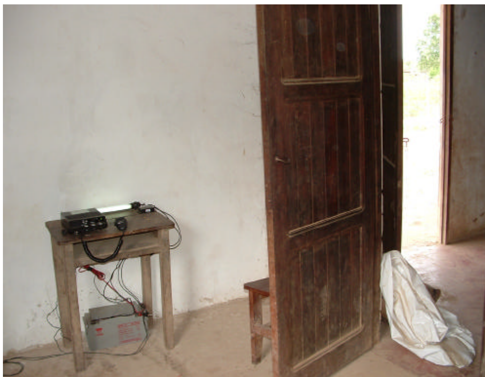
EQUIPO DE TRANSMISIÓN INSTALADO