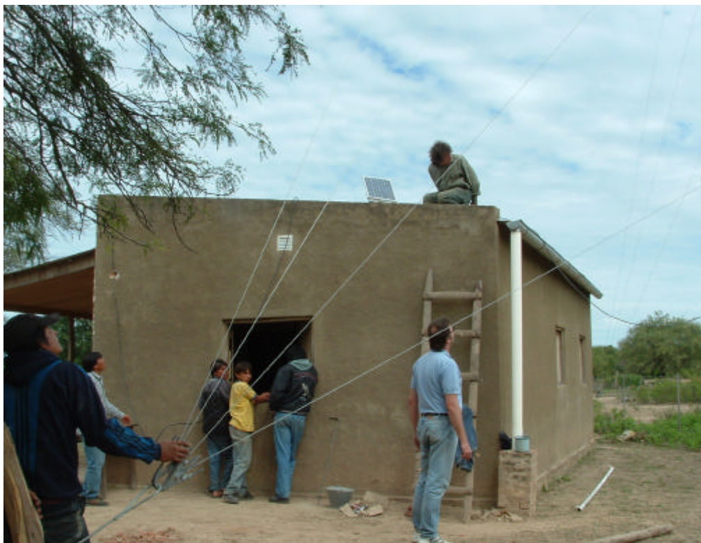
SALON COMUNITARIO – SALA DE TRANSMISION