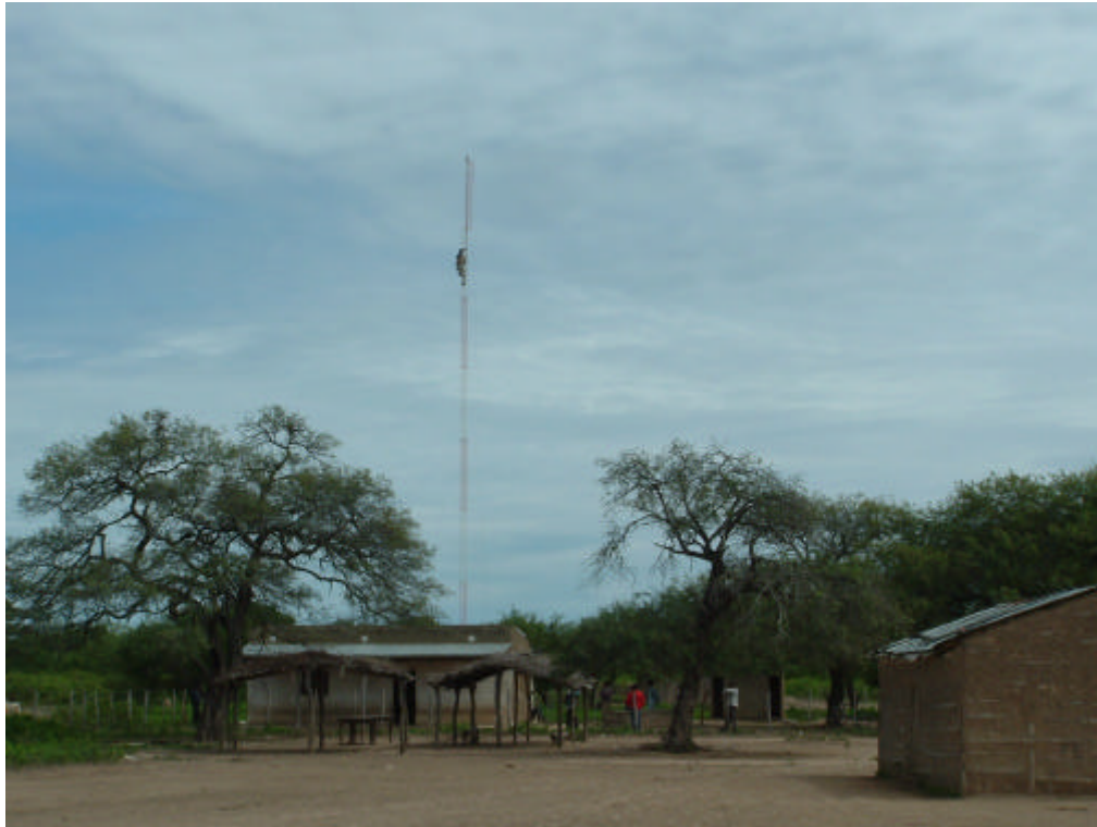
EMPLAZAMIENTO DE LA TORRE