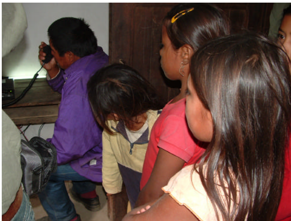
PRIMERA TRANSMISIÓN EN COMPAÑÍA DE NIÑOS DE LA COMUNIDAD