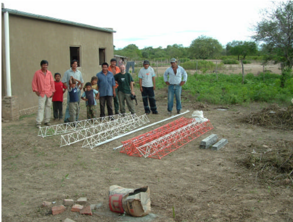
UBICACIÓN DE LOS MATERIALES EN EL SITIO DE CONSTRUCCION

A continuación y con el fin de documentar esta obra, se adjuntan algunas fotografías que atestiguan el medio ambiente en el cual este proyecto se llevó adelante y como queda en manos de esta comunidad el equipo instalado.